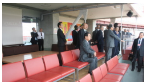
ラグジュアリーフロア