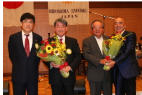
次年度会長・幹事より花束贈呈